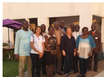
CNESVS de Côte d'Ivoire Novembre 2018, Abidjan, Côte d'Ivoire