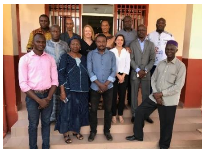
CNERS de GUINEE, Décembre 2018, Conakry, Guinée