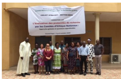
CNERS du Bénin Septembre 2018, Grand-Popo, Bénin

Ces formations furent aussi une occasion unique d'aborder la question de l'engagement communautaire, et les spécificités liées à l'information et au consentement des populations de chaque pays, selon le point de vue des Comités d'éthique, et d'approfondir certains enjeux éthiques cruciaux en relation avec le développement des études génomiques et du « Big data ».